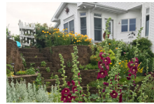
Maestro del Área de Madison Jardineros | Pág. 8