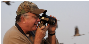
Salvando grúas y Humedales | Pág. 4