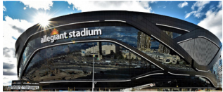
Explorando lo más nuevo Estadios | Pág. 10