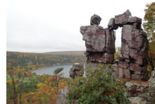
Lago del diablo virtual Tour | Pág. 3