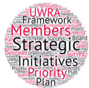
Plan estratégico | Pág. 4