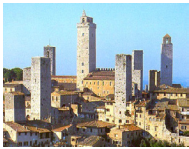
托斯卡納的虛擬旅行 希爾鎮 | g 10