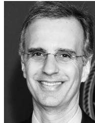
喬·帕里西 自2011年以來一直擔任戴恩縣行政長官。他曾任職於國會和戴恩縣文員。