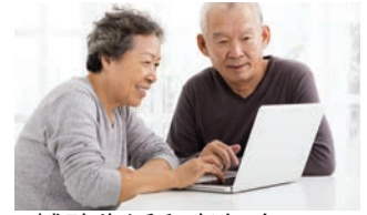
輔助生活和老年人 主頁合約 | p. 5