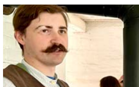
Visita el Viejo Mundo Wisconsin | pag. 4