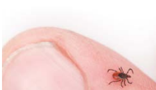
Temporada de garrapatas | pag. 8