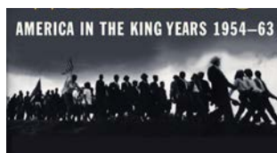
Reseña del libro: Partiendo el Aguas | pag. 11