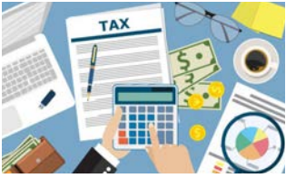
稅務準備網絡研討會 | 頁。4