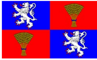
住在加斯科尼 | 頁。5