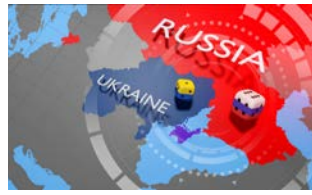
烏克蘭戰爭 | 高分辨率照片 | CLIPARTO 頁。5