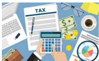
Seminario web de preparación de impuestos | pags. 4