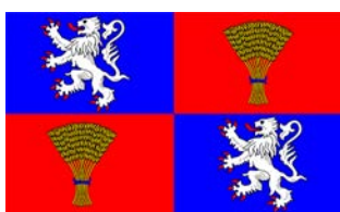
Vivir en Gascuña | pags. 5