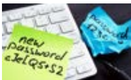
Usar una contraseña Gerente | pags. 11