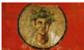
misterios en la antigüedad Roma | pags. 5