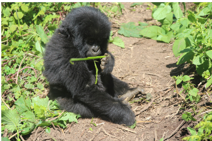
Gorila de montaña de seis meses.